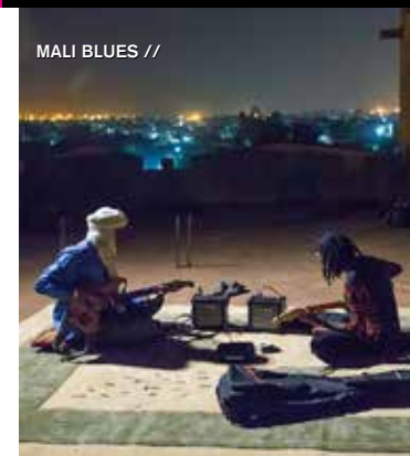
MALI BLUES //

Glass wird mit 18 Jahren Alleinerzieherin von Phil und Dianne. Unangepasst und unkonventionell werden die Kinder groß, sodass Sexualität und auch Homosexualität angstfrei erlebt werden kann. Ein Geheimnis könnte aufgearbeitet werden: Wer ist der Vater der Zwillinge? Nach dem gleichnamigen Roman von Andreas Steinhöfel, mit großartiger Besetzung und melancholischer Grundstimmung. Ein sehenswerter Jugendfilm.