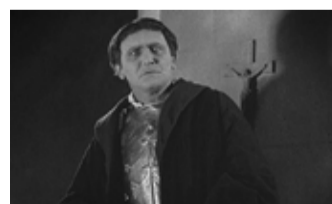
Andere Filme anders zeigen // Sondervorstellungen im November

Mi. 29.11. um 18:00 // OmU F/USA/B/CH 2016 // 95 min // FSK 12 Was heißt es, schwarz zu sein? Der Dokumentarfilm lässt den 1987 gestorbenen Schriftsteller James Baldwin sprechen und zeigt: Er war seiner Zeit in allem voraus. In Kooperation mit dem Netzwerk Antidiskriminierung e. V. Reutlingen/Tübingen