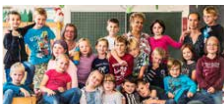
Ich. Du. Inklusion. //

Mi. 22.11. um 18:00 // D 2017 // 95 min // FSK 0 Der Dokumentarfilm zeigt einen offenen und direkten Schulalltag und wie es ist, wenn der Inklusionsanspruch auf Wirklichkeit trifft. In Kooperation mit dem Netzwerk Antidiskriminierung e. V. Reutlingen/Tübingen