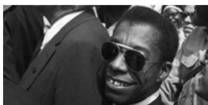
I Am Not Your Negro //

Mi. 22.11. um 18:00 // D 2017 // 95 min // FSK 0 Der Dokumentarfilm zeigt einen offenen und direkten Schulalltag und wie es ist, wenn der Inklusionsanspruch auf Wirklichkeit trifft. In Kooperation mit dem Netzwerk Antidiskriminierung e. V. Reutlingen/Tübingen