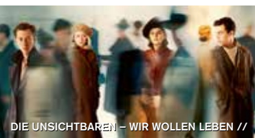
DIE UNSICHTBAREN – WIR WOLLEN LEBEN //