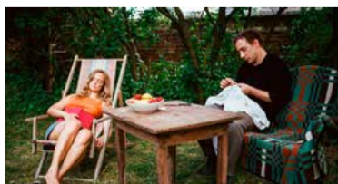
Adam und Evelyn // 03.07. 16:00

1989: Adam und Evelyn aus der DDR machen Urlaub in Ungarn. Dann ist plötzlich die Grenze offen... In Kooperation mit der Stadtbibliothek Reutlingen.