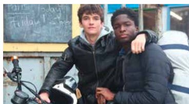
Roads // ab 04.07.

Trump und Amerika. Die neue Doku von Michael Moore. In Kooperation mit der vhs Reutlingen.