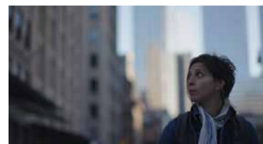
PUSH // 17.07. 18:00

Zwei Filme (»Weggeworfen« und »Lunchbox«) und ein indisches Mittagbuffet. In Kooperation mit dem Slow Food Convivium Tübingen/Neckar-Alb.