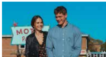
Der unverhoffte Charme des Geldes // ab 01.08.

Französisch-chinesische Familiengeschichten. Culture-Clash-Komödie.