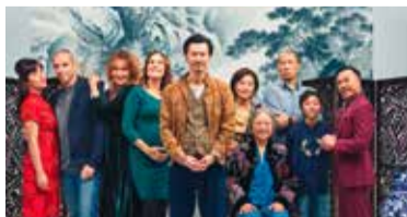
Made in China // ab 01.08.

Französisch-chinesische Familiengeschichten. Culture-Clash-Komödie.