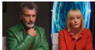
Leid und Herrlichkeit // ab 08.08.

Ganovenmärchen. Robin Hood trifft Pretty Woman. Bundesstart!