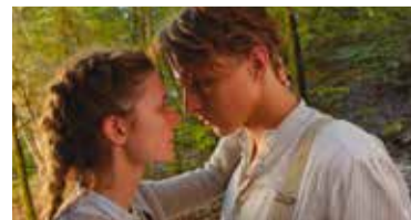
A Geschichte über d'Lieb // ab 29.08.

Wir machen Urlaub! Unser Tipp: Open Air Kino im Spitalhof ab 13.08.